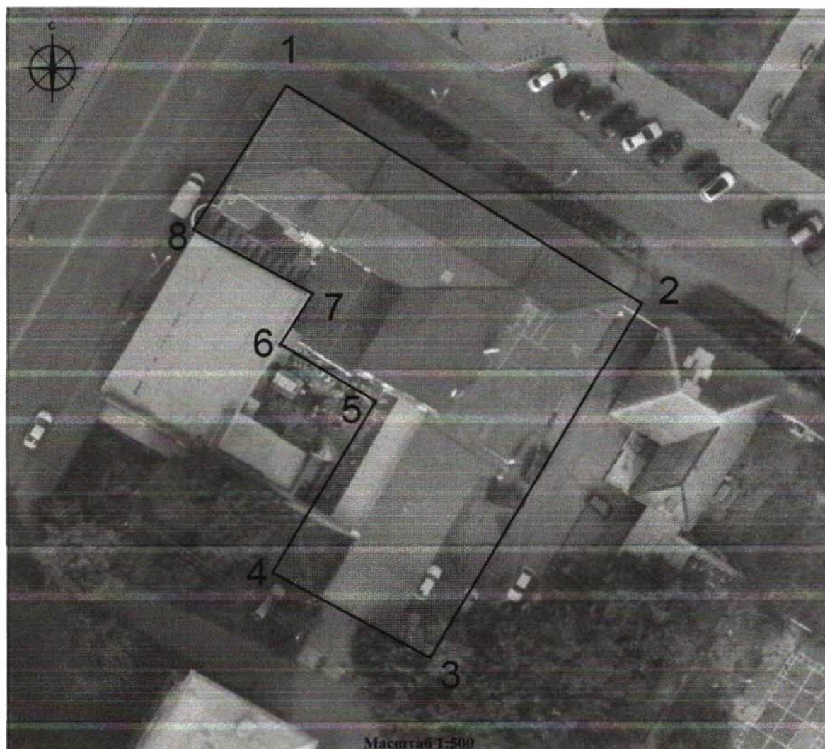
Схема границ территории объекта культурного наследия регионального значения «Дом Дьяконова», расположенного по адресу: Республика Башкортостан, г. Стерлитамак, ул. Худайбердина, 17

Используемые условные знаки и обозначения: