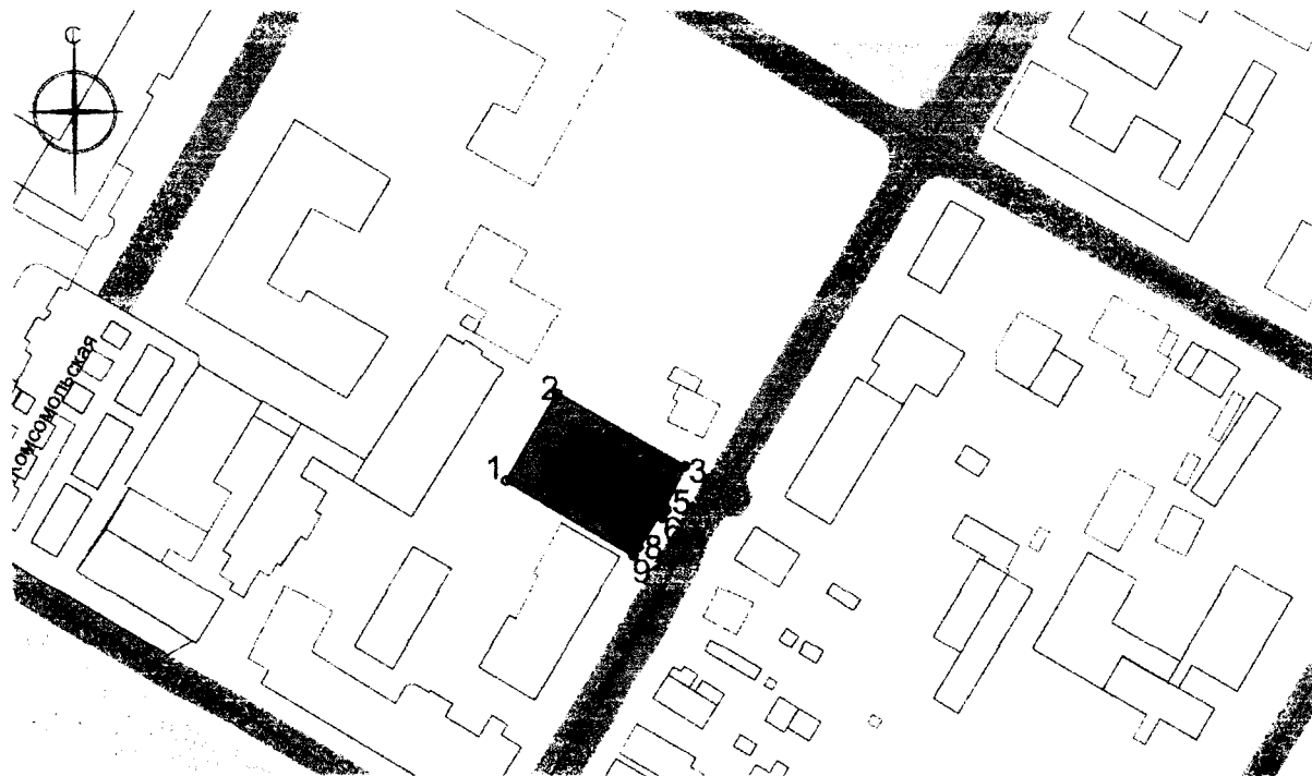
Схема границ территории объекта культурного наследия регионального значения «Жилой дом», расположенного по адресу: Республика Башкортостан, г. Стерлитамак, ул. Карла Маркса, 107

Используемые условные знаки и обозначения: