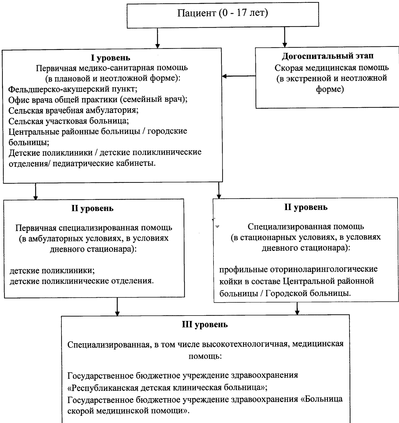
Схема маршрутизации детского населения Республики Башкортостан при оказании медицинской помощи по профилю «оториноларингология»